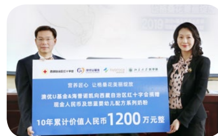
澳優U基金與海普諾凱生物科技業務單元向西藏紅十字會捐獻現金及悠藍嬰幼兒配方奶粉，總值人民幣120萬元，以於未來十年支持當地健康系統。

此活動來到第三年，繼續夥同西藏紅十字會及西藏大學，於二零一九年度籌辦慈善學術西藏交流團。此計劃提供機會，讓專家團隊於醫院、診所及其他醫療健康機構舉行講座並展開連串討論，課題涵蓋科研、社會服務及公眾對營養與健康的意識。於西藏多個縣市為期11天的訪問行程中，計劃盡力培養當地醫療人員，希望最終能夠加強西藏母嬰健康系統。