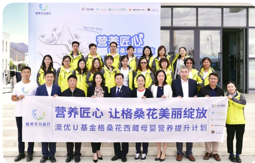
「營養匠心 讓格桑花美麗綻放—澳優U基金格桑花西藏母嬰營養提升計劃」於二零一九年八月啟動。

在澳優U基金帶領下，海普諾凱生物科技業務單元再次與北京大學醫學部攜手推出「格桑花公益行」活動，希望鞏固與非牟利機構、大學及企業的夥伴關係，為中國貧困地區的母嬰提供更好的照顧。