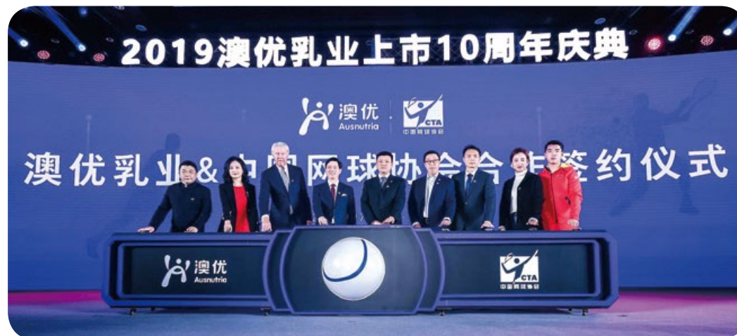
澳優公開上市十周年慶典。

就此，澳優U基金於二零一八年啟動，有系統地提倡社會責任，促進社會和諧，工作專注於扶貧、賑災與增進公眾健康。在澳優公開上市十周年誌慶之時，本集團承諾透過澳優U基金於未來十年向社區捐出現金及捐獻實物，總值人民幣1億元。在本集團大力支持下，澳優U基金昂首承擔社會責任，正計劃與慈善團體及個人建立夥伴關係，以創新的方式有力地推動社區成長。