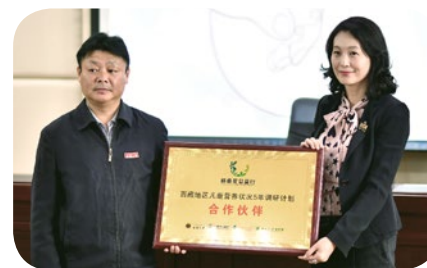
澳優與西藏大學簽署協定，就西藏0至6歲兒童餵哺模式以及營養及成長狀況進行科研，冀能為扶貧提供科學數據。