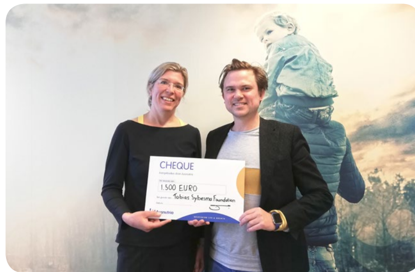
本集團代表其僱員向The Tobias Sybesma Foundation捐款。

澳優荷蘭推出僱員主導慈善計劃，鼓勵僱員提出意念，幫助當地兒童，獲選項目可獲得預算。澳優相信，僱員得到更多計劃主導權會更主動地參與社區活動。本年，有賴僱員積極參與，本集團支持了不同的獲選提案。其中，澳優捐款支持荷蘭The Tobias Sybesma Foundation的腦幹癌治療研究項目。該基金會的命名源於一名死於腦幹癌的12歲男童。