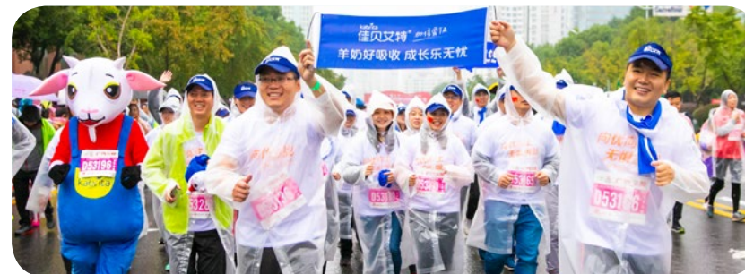
澳優的佳貝艾特團隊參與馬拉松，支持是次長沙盛事。