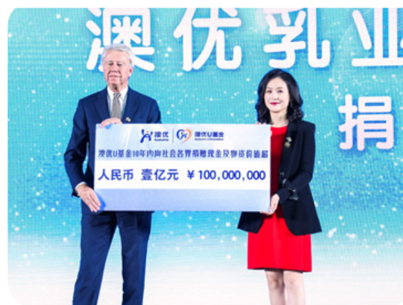
澳優向澳優U基金注入人民幣1億元，供其未來十年的社區項目動用。