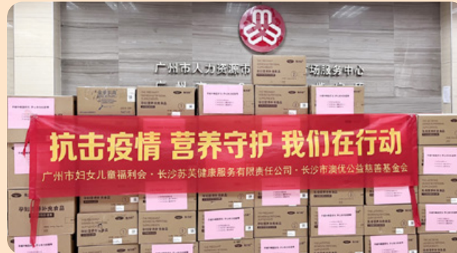
● 於二零二二年四月二十九日，澳優基金會收到廣州市婦女兒童福利會的感謝信，答謝於疫情期間捐贈價值超過人民幣180萬元的營養品予廣州市的孕婦及嬰幼兒。