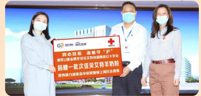
● 於二零二二年四月十四日，在湖南省紅十字會的支援下，澳優基金會捐贈一批次抗疫物資予湖南中醫藥大學第二附屬醫院的醫療團隊，為參與上海抗疫工作的前線醫療專家提供補給，注入溫暖。