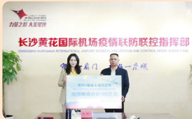
● 長沙黃花國際機場疫情聯防联控指揮部的代表於三月第二次接收澳優基金會及佳貝艾特業務單元捐贈價值人民幣100萬元佳貝艾特配方羊奶粉，為前線人員監控疫情提供營養支援，並感謝他們的努力。

在中國，澳優自2019冠狀病毒病爆發之初，已一直參與抗疫工作，展現其對控制疫情的迅速反應。澳優亦支援多個機構和組織，包括湖南省紅十字會、長沙黃花國際機場疫情聯防联控指揮部、湖南中醫藥大學第二附屬醫院、廣州市婦女兒童福利會等等。除對前線抗疫工作人員表達由衷謝意外，本集團亦協助弱勢社群在社交距離或封城等政策下維持生計及預防被病毒感染，捐贈現金和實物如瓶裝配方奶粉、營養和保健產品，以及醫療物資。