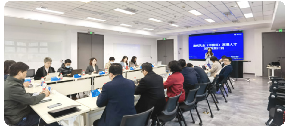
● 中國的高潛人才培養計劃。

澳優亦已制定正式的員工評核系統以評估個別僱員表現及支持他們的持續發展，旨在鼓勵僱員的問責性，並在個人、部門及組織層面上提升生產力。我們已於中國、荷蘭及澳洲實行該系統，並計劃擴大至其他旗下附屬公司。在澳優中國，我們採納「a+b+c+N」評核模型，以結構性及全方位的方式檢討僱員表現。以個人及公司表現提升為重點，包括技術知識、溝通及人際技巧，以及行動計劃與發展目標的達成進度，在關鍵職位表現出色的僱員將獲得形式多樣的獎勵，包括研發創新花紅、技術創新花紅、股份獎賞及年終花紅等。該評核模型旨在激勵僱員不斷改善工作表現及生產力，並表彰他們不懈的努力。