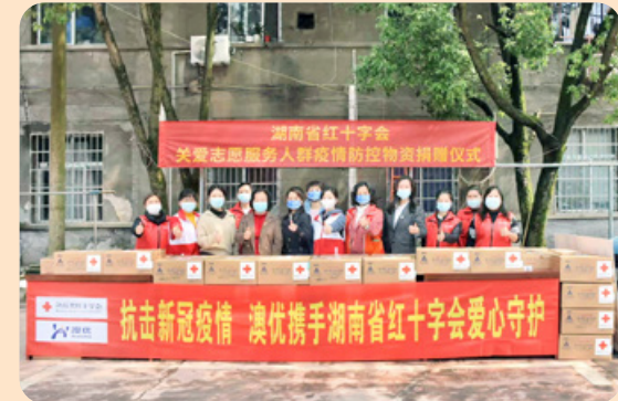
● 於二零二二年四月七日，澳優基金會捐贈數千罐配方奶予湖南省紅十字會的前線醫療人員及社區人員。