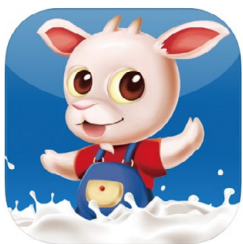
澳優乳業(中國)有限公司的商業應用程式

澳優亦充分利用社交媒體的影響力，為旗下主要乳製品品牌，包括佳貝艾特、海普諾凱1897、能立多、Nutrition Care、美納多、悠藍及紐萊可，在中國建立官方微信平台。此等渠道不單能推廣本集團的產品及營銷活動，更可成為父母及準父母交流照顧嬰幼兒心得以及提出關於澳優產品反饋及查詢的平台。為確保所有資訊準確無誤，不會危害其他父母及其子女的健康，本集團的專業營養師會參與管理該等線上平台。此外，佳貝艾特流動應用程式的功能性在二零一九年有所提升，加強數據分析，讓本集團能更了解終端用家的需要，並為顧客提供特設的生日祝賀及其他營銷訊息，以陪伴尊貴會員的家庭一同成長。本集團期望透過佳貝艾特流動應用程式為顧客提供超乎預期的獨特個人化體驗。