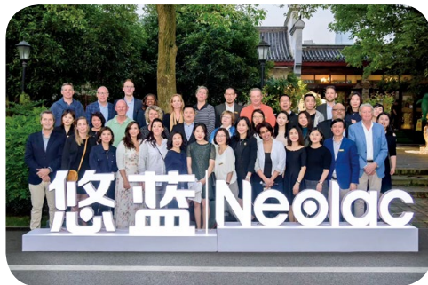
悠藍的管理團隊及營銷團隊在中國聚首一堂，推動全球營銷願景。

澳優於二零一九年度舉行首個全球營銷會議，以協調全球的營銷及顧客參與工作，並統一旗下產品系列（包括佳貝艾特、能立多、海普諾凱1897、悠藍及美納多）質量如一的品牌形象。本集團於會上宣揚全球營銷願景及戰略，涵蓋澳優在十一個國家及地區分支的最佳營銷及溝通手法。會議成功促進營銷專家之間的經驗分享及創新，協助澳優在參與及溝通計劃中更有效地回應顧客的需要。