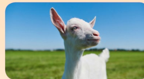
Nutritional Expert Academy Introduction to goat milk based nutrition The Netherlands, November 12 th – 15 th 2019

於二零一九年十一月，澳優邀請了三十位保健專家參加在荷蘭舉行的二零一九澳優營養專家學院，以認識羊奶基營養的獨特性。藉着分享最新科學見解及將知識與實際經驗融匯貫通，該項為期四天的活動旨在加深參與者對羊奶產品的認識。除座談會及工作坊外，該活動亦包括羊奶農場及澳優海倫芬工廠的導賞團，向專家展示配方羊奶粉從養殖至包裝的整個生產流程。