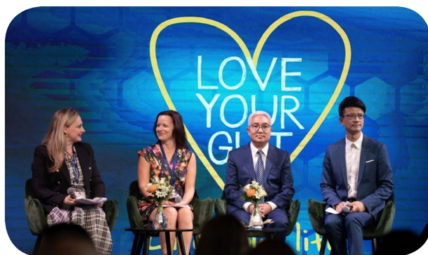
召集專家小組舉行專題研究會，評估全球腸道健康危機，並剖析未來改善腸道健康的新方向。