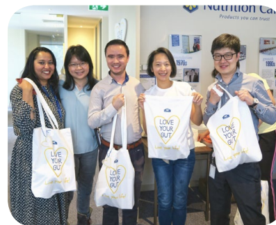
參與者獲贈本集團的營養品，滿載而歸。