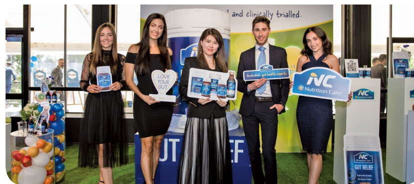
本集團推出最新營養品，幫助顧客實現良好的腸胃健康。