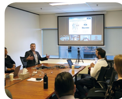
與參與者分享有關良好腸胃健康的飲食及生活小錦囊。