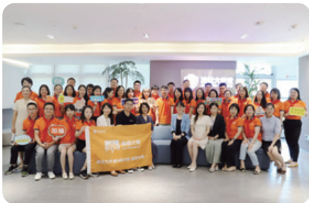
● MBA班 (澳橙計劃)