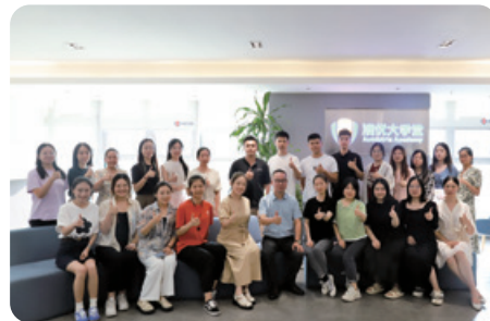
● MBA前置班 (澳青計劃)

澳優針對準備擔任管理層職位的僱員提供培訓，讓彼等掌握溝通、策略實施及人才評核方面的技能，以進一步發掘彼等的潛能，提高彼等的領導能力，帶領組織持續增長。培訓由各部門的人員提供，以分享彼等的專業知識。在計劃實施的過程中，本集團將全程密切監察僱員的學習進度，並滿足彼等的不同需要。