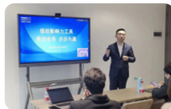
● 中國高潛人才計劃

澳優針對準備擔任管理層職位的僱員提供培訓，讓彼等掌握溝通、策略實施及人才評核方面的技能，以進一步發掘彼等的潛能，提高彼等的領導能力，帶領組織持續增長。培訓由各部門的人員提供，以分享彼等的專業知識。在計劃實施的過程中，本集團將全程密切監察僱員的學習進度，並滿足彼等的不同需要。