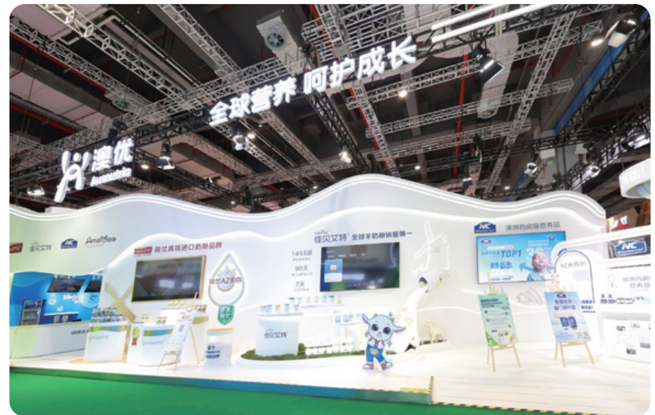
第八屆中國國際進口博覽會上澳優的展位

進博會期間，Nutrition Care推出三款鼻敏益生菌新品及NC恬睡益生菌；佳貝艾特發布佳貝艾特營嘉高鈣益生菌羊奶粉新品；海普諾凱推出能立多升級版。這些新品進一步豐富本集團針對不同年齡層、多元生活場景的營養健康產品組合。作為連續八年參展商，澳優持續利用進博會這一中國推進高水平對外開放的重要平台，加強全球合作及市場洞察，加快科研創新，推進「引進來」與「走出去」協同策略，進一步拓展全球化創新發展新格局。