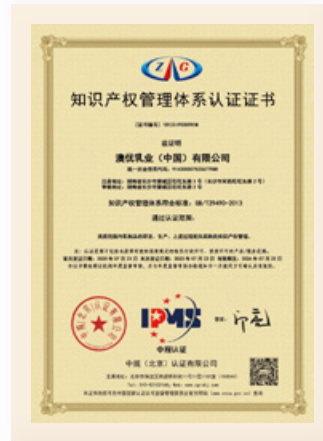
◻ 企業知識產權管理認證。

澳優持續加強科研及知識產權儲備，系統化增強專利及商標組合，以支持產品迭代及本集團長遠發展。二零二五年，本集團共申請20項專利，包括18項發明專利，並新增31項有效專利，涵蓋26項發明專利及7項收購發明專利。年內，本集團亦提交31份商標註冊申請，並註冊56個商標。此外，本集團發表49篇研究論文，持續鞏固科研成果並為業內知識分享作出貢獻。