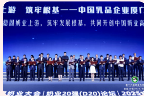
第十六屆奶業大會

二零二五年七月十三日至十五日，第十六屆奶業大會、奶業20強(D20)論壇、2025中國奶業展覽會在廈門舉辦。透過專題研討會、展位展示等系列活動，會議促進乳業高質量發展關鍵議題的交流，評估轉型趨勢及發展路向，凝聚共識支持中國乳業振興升級。